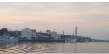
ここで、ご当地ヨットと遭遇。温泉まで送って頂く。係留は漁船横抱き。