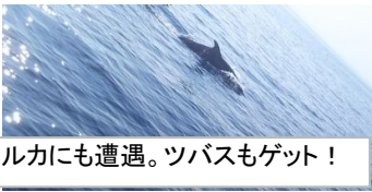
イルカにも遭遇。ツバサもゲット！

朝市で、栄螺のつぼ焼きで乾杯。 6日の朝は10時に出発。ヨットに持ち込んだのどろを焼いてまた乾杯！好天ならばこそ