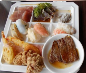
パーティーは6時～飲むわ、食べるわ、話に花が咲く わで、あっという間に9時前。語りつくせず各艇に集 まり、深夜まで、2次会・3次会とにぎわった。