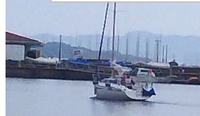
夜が明けて見上げると曇り空。雨が降るまでまだ時 間はありそう。早々とマリーナシティを後にする艇 、悠然と機走で替える艇、洲本にランチに向かう艇、 エンジントラブルで、曳航する艇・・・それぞれの航 海で、夕刻までに、全艇無事帰港。