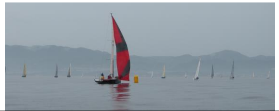
微風を捉えてするすると抜け出したのは Spirit of Shiwaku