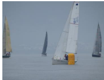
上マークでドリーマーを 交わして巧者ぶりを発揮 し修正 3 位に。