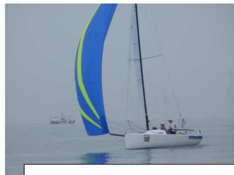
軽風を丁寧に拾ったプチスターは 修正 2 位に。