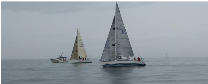
終わってみれば、A クラス優勝は、海燕！おめでとう！