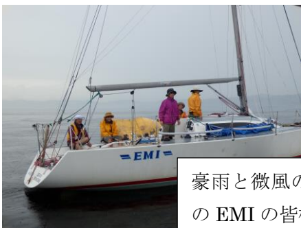
豪雨と微風の中、明細灰 の EMI の皆様お疲れ様