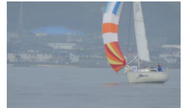
大型艇の間に割って入り、軽風を見事に制した、Kotaro は修正 2 位。グラシヤス 1 3 世は修正 3 位