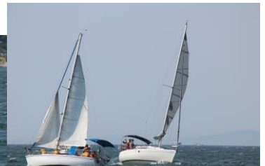
午前・午後共に好天に恵まれ、強風の中参加者には貴重な初体験となりました。