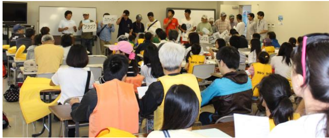
協力艇のキャプテン紹介

午前、午後共に初心者にはきつめ。15ノットを超える風に恵まれ、参加者の皆さんには大いに楽しんで頂きました。