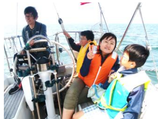
好奇心旺盛の少年、目つきが違う。