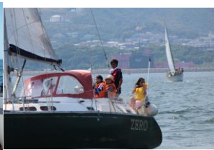
外国人の参加者も、初めてのセーリングにご機嫌！