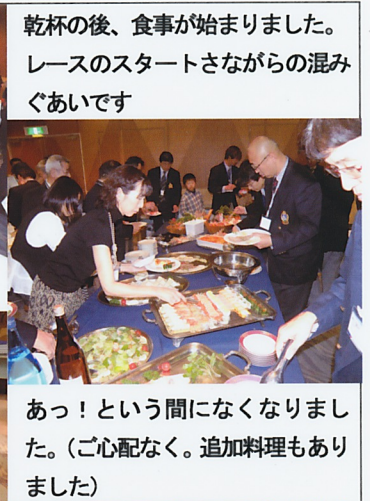
乾杯の後、食事が始まりました。レースのスタートさながらの混みぐあいです