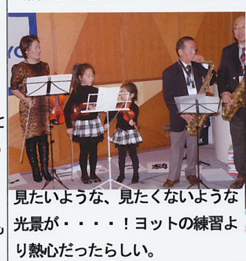
見たいような、見たくないような光景が・・・！ヨットの練習より熱心だったらしい。