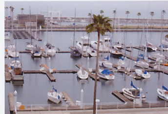
マリナーシティでの豪華 一泊プチクル