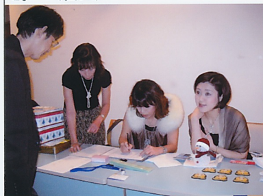
今年もきれいなお姉さまが受付してくれました。E^^・・・