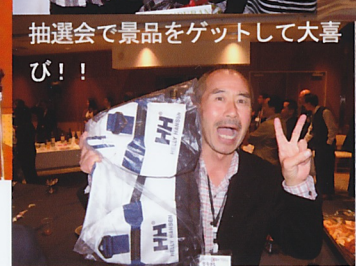
抽選会で景品をゲットして大喜び!!