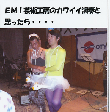
EMI芸術工房のカワイイ演奏とと思ったら・・・