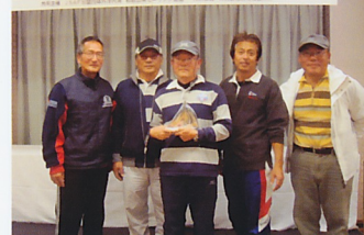
優勝したスターオブ ベツレヘムのメンバ ー