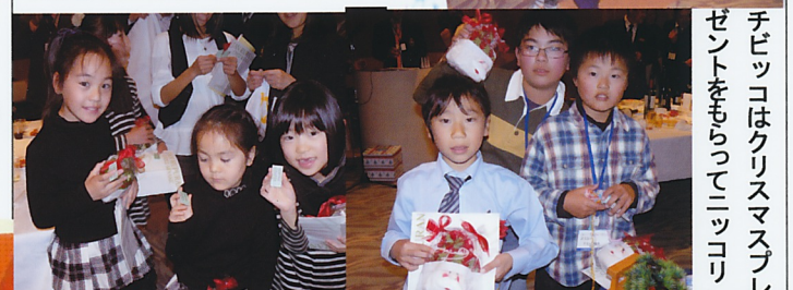
チビッコはクリスマスプレゼントをもらってニッコリ