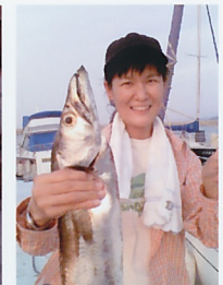
獲物を手にご満悦