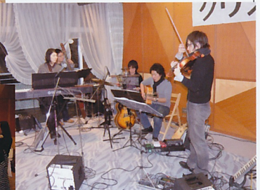
大いに盛り上がりました。