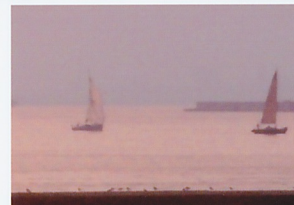
夕暮れのフィニッシュラ インを横切り優勝(左)