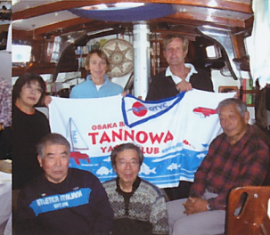
ヨット訪問時のトムさん とベッキーさん