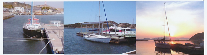
瀬戸内海直島に集結した各艇 左からZERO、幸宝、PUKUPUKU