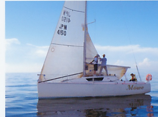
レースは無風で残念でしたが、パーティーは生演奏で盛り 上がりました