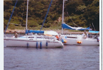
友が島での自然志向島影 アンカリングプチクル