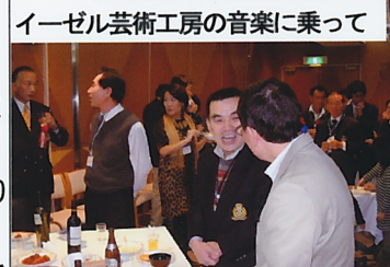
イーゼル芸術工房の音楽に乗って