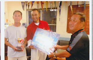
表彰式でのMOWEメン バー