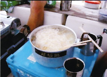
「ZERO」での調理風景 なかなか凝っています (薬味もそろえて本格的)

ハプニング発生！ 走錨した「Puku」のアンカーをあわてて打ち直し。あわやPukuになるところでした