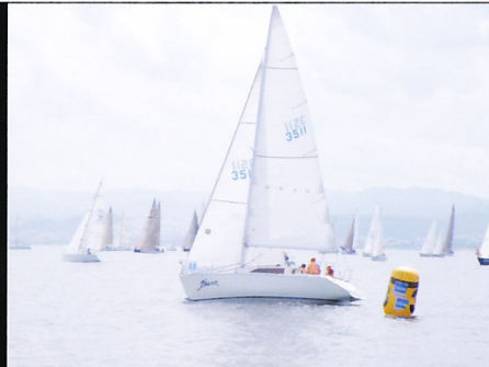
久しぶりのレース参加であったがいきなりAクラス優勝のドリーマー