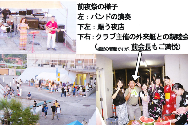
前夜祭の様子 左：バンドの演奏 下左：賑う夜店 下右：クラブ主催の外来艇との親睦会 (撮影の邪魔ですが、前会長もご満悦)

逆のぼって、レース前日は、クラブテント村で「かき氷」の無料サービスや、夕暮れてクラブハウスで外来艇クルーを接待して交流を深めた。また、バンド演奏に熱を上げ、かつらぎ煙火の力作の打ち上げ花火に酔いしれた。(吉田 記)