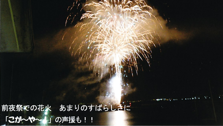
前夜祭での花火 あまりのすばらしさに「こが〜や〜」の声援も！！