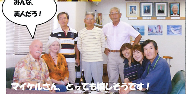
マイケルさん、とっても嬉しかったです！