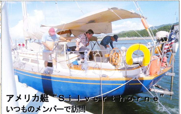
アメリカ艇“Silverthorne”いつものメンバーで訪問