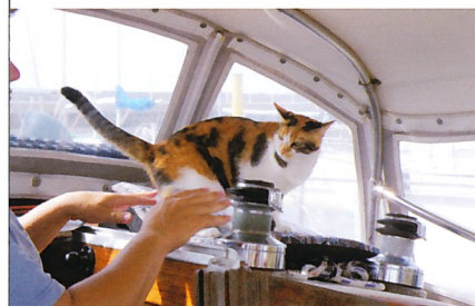
ヨヒーラのコワ〜いボースンのマヤちゃん不審者は威嚇されます

当地シアトルのヨットクラブCYCには、来淡時に贈呈したわがクラブのバージが翻ることになりました。これからも宜しく、Please keep in touch! とのことです。