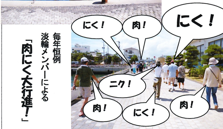
毎年恒例 淡輪メンバーによる 「肉にく大行進！」