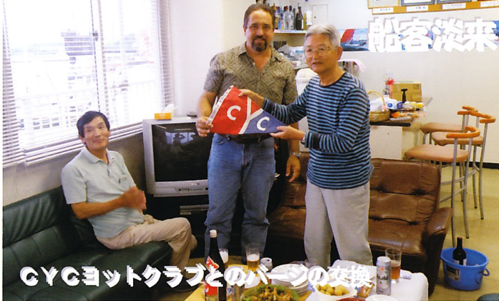
CYCヨットクラブとのバーجの交換