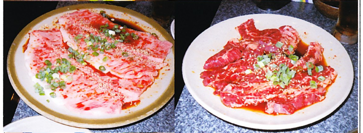
左：ヘレ肉 下左：霜降り？特上サーロイン 下右：ハラミ