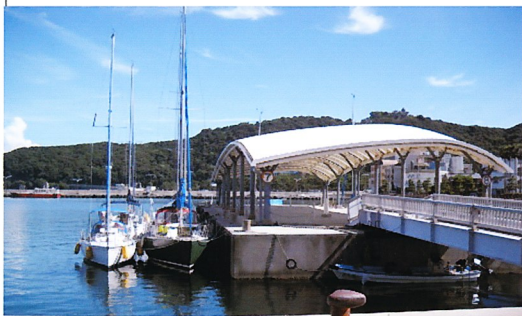
洲本港に到着した各艇