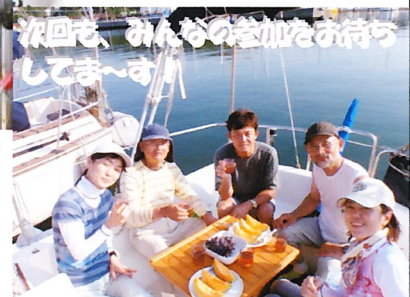
次回も、みんなの参加をの待ちしてま〜す