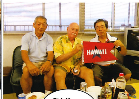
ハワイヨットクラブとのバージの交換