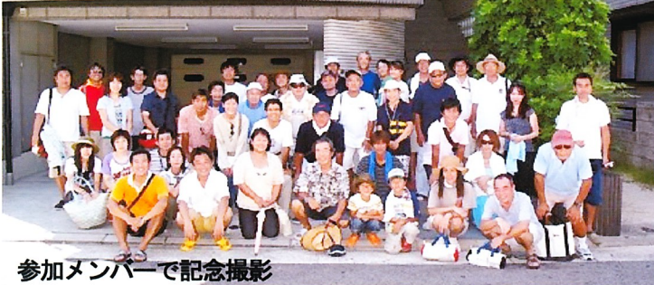
参加メンバーで記念撮影