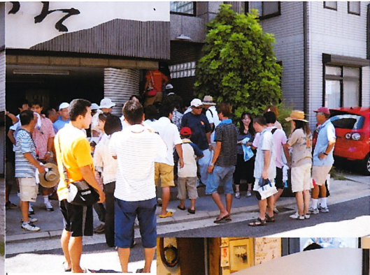
焼肉「さかた」に到着