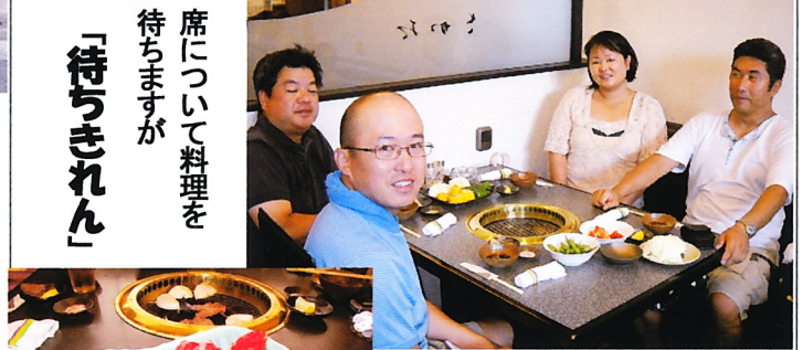
席について料理を 待ちますが 「待ちきれん」