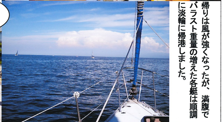
帰りは風が強くなったが、満腹で バラスト重量の増えた各艇は順調 に淡輪に帰港しました。